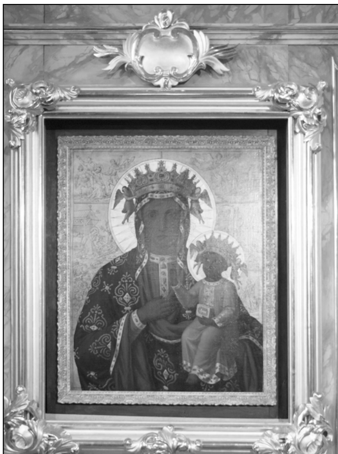
Obraz z kościoła św. Mikołaja w Jedlni

za stronę /jasnagora.com/ oprac. ks. Janusz Smerda