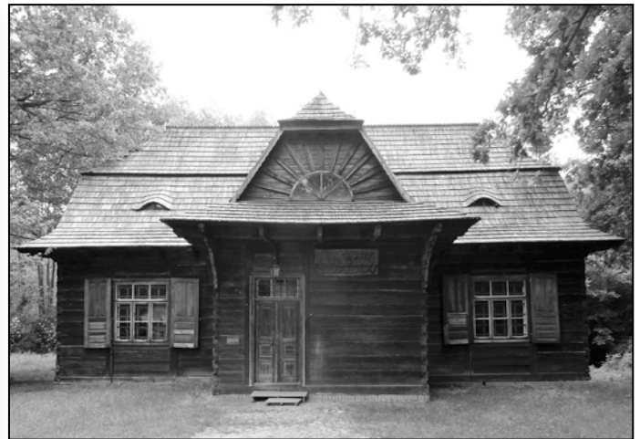
Dom Ludowy w Jedlni-Poświętne: http://www.muzeum-radom.pl/muzeum-wsi-radomskiej/wystawy-stale/dom-ludowy-z-jedlni-poswietnego/1080 dostęp: 21 VI 2017 r.